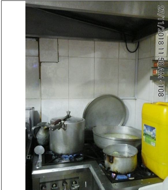
Fotografía No.3 Estufa de 4 puestos.