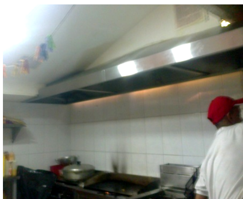
FOTOGRAFÍA 5: CAMPANA EN ÁREA DE COCCIÓN