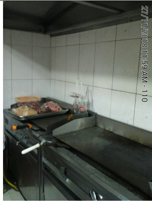
Fotografía No. 4 Parrillas de 6 flautas.