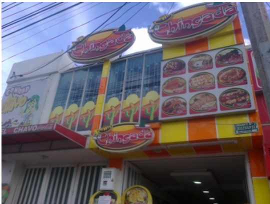
FOTOGRAFÍA 1: FACHADA DEL PREDIO