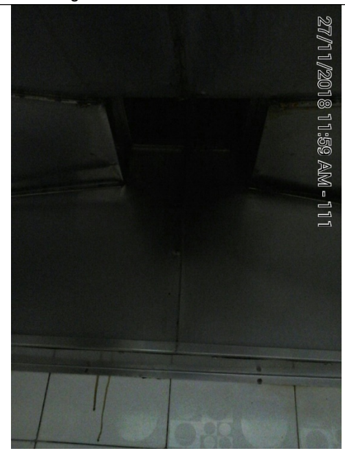
Fotografía No.6 Sistema de extracción.