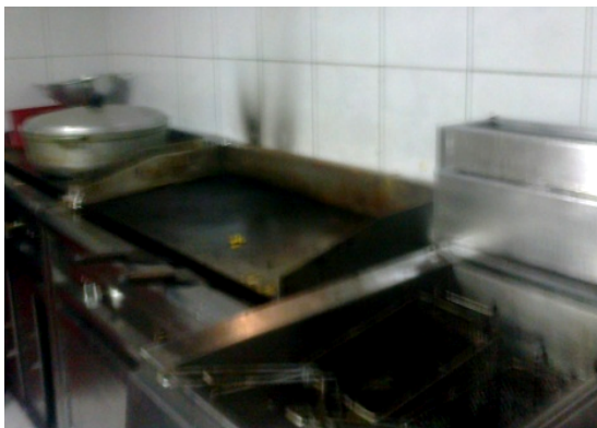
FOTOGRAFÍA 3: PLANCHA Y FREIDORA EN ÁREA DE COCCIÓN