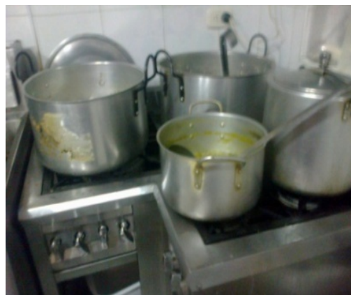
FOTOGRAFÍA 4: ESTUFA EN ÁREA DE COCCIÓN