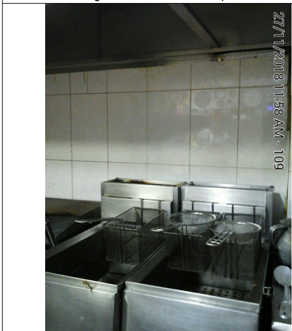
Fotografía No.5. Freidoras de 4 puestos.