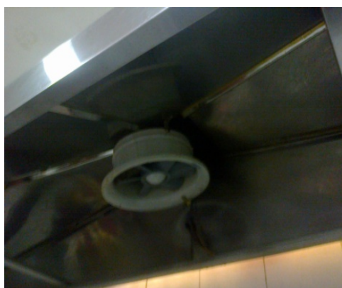
FOTOGRAFÍA 6: EXTRACTOR DE LA CAMPANA