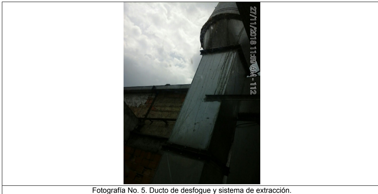
Fotografía No. 5. Ducto de desfogue y sistema de extracción.